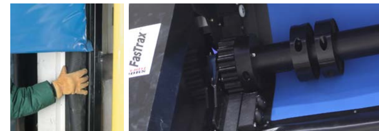
Grijana cijevna brtva

Smanjuje se potreba za dodatnim grijačima i zračnim zavjesama koji su veliki potrošači energije.